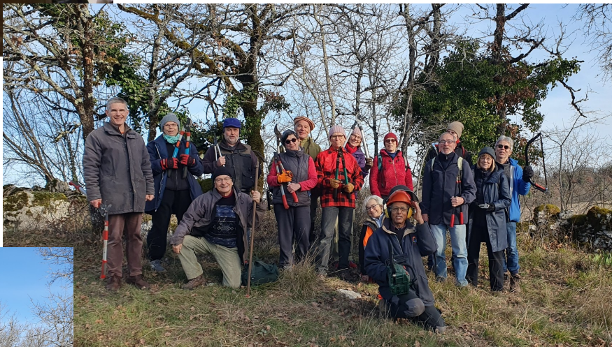
et récompensée par un généreux pique nique