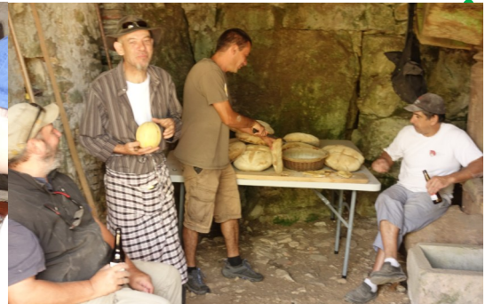
EN JUILLET ET AOÛT : VANNERIE, RUCHE, PAIN D'ÉPICE, FÊTE DU PAIN AU MOULIN DES NOUALS