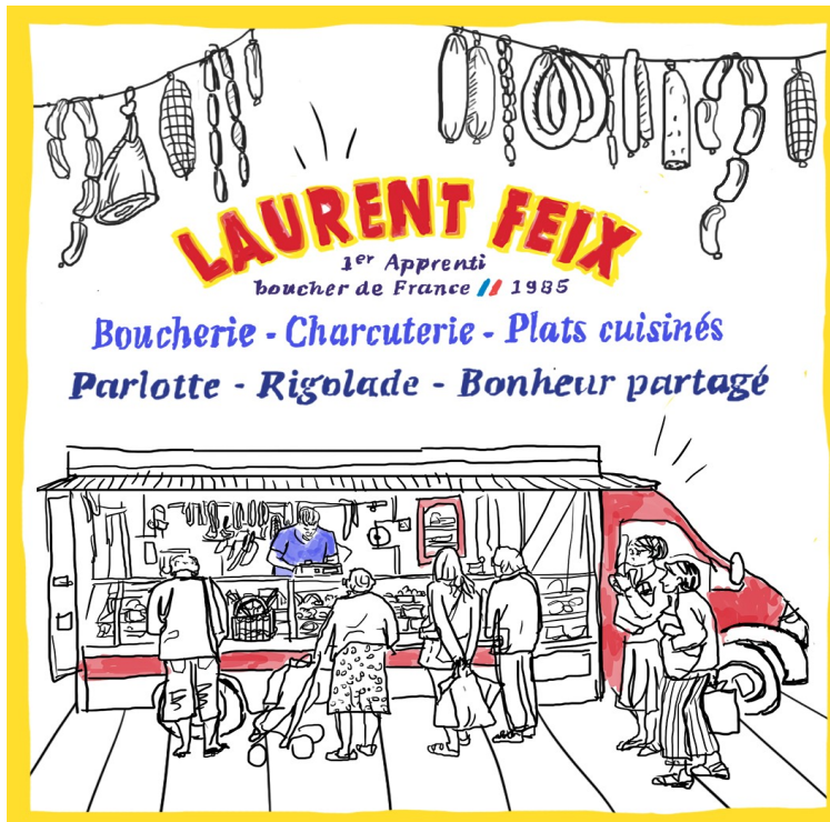
Dessin de Quitterie Belleau