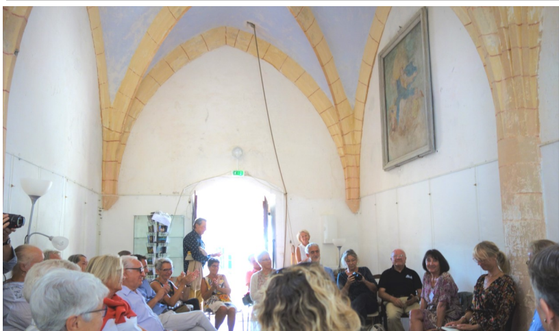
Festival du livre du Haut Quercy : nombreux auditeurs pour la séance de lecture ce 21 septembre à la chapelle St Roch