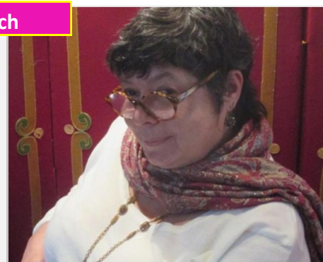
« Charles Perrault » par Sophie Beaucourt