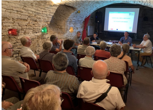
L'assemblée générale du 2 août 2019

Par ailleurs, ce projet devenu maintenant réalité participe à la pérennisation d'une activité pastorale , valorise une ressource fourragère renouvelable et garante d'espaces ouverts hétérogènes. Il permet également une certaine lisibilité et remise en valeur du petit patrimoine (gariottes, cazelles, murets de pierres sèches, puits... et chemins).