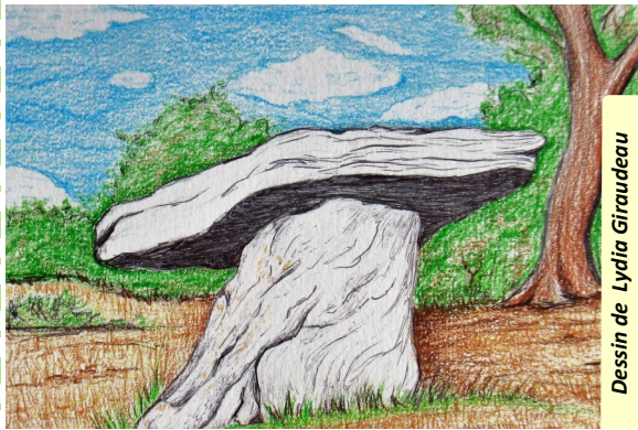
Dessin de Lydia Giraudeau