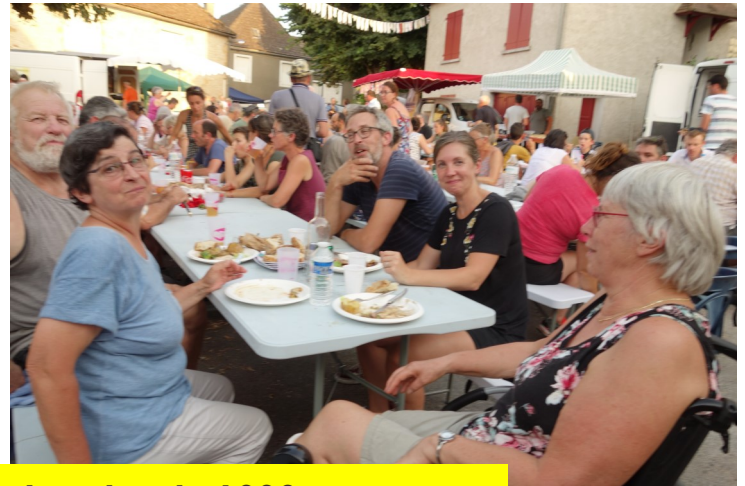
Marchés de juillet et août : plus de 1000 gourmets