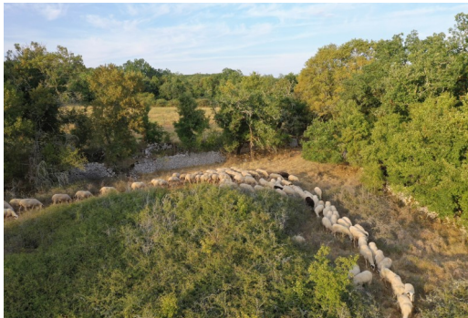
L'activité pastorale se développe