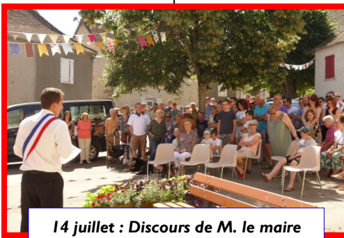
14 juillet : Discours de M. le maire