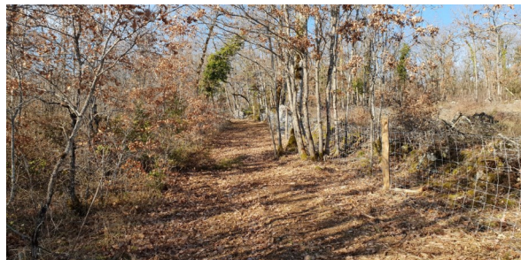
Réalisation de layons et pose de clôtures sur le Causse

Concrètement, le regroupement des propriétaires en « Association Foncière Pastorale Libre » a permis de mobiliser des financements pour l'aménagement et l'acquisition d'équipements pastoraux (layons et clôtures, barrières, etc...) et de transmettre et accompagner la gestion éco-pastorale à des éleveurs locaux regroupés en association d'éleveurs .