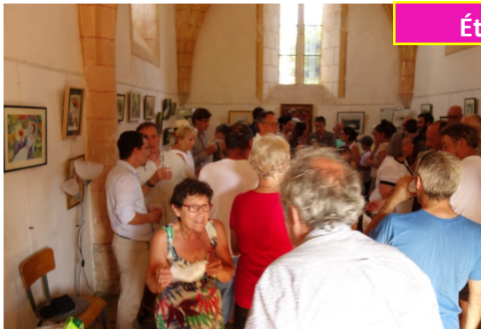
Peintures de Brigitte Tournier