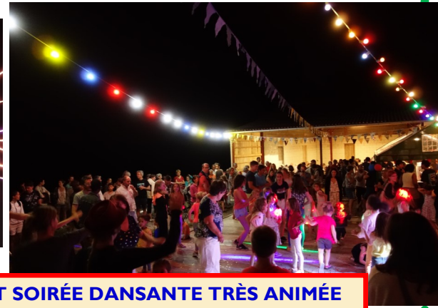
13 JUILLET 2019 : À POUZALS FEU D'ARTIFICE ET SOIRÉE DANSANTE TRÈS ANIMÉE